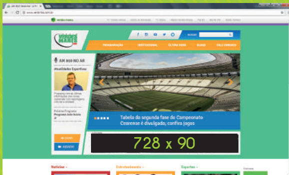
Super Banner 728x90 px