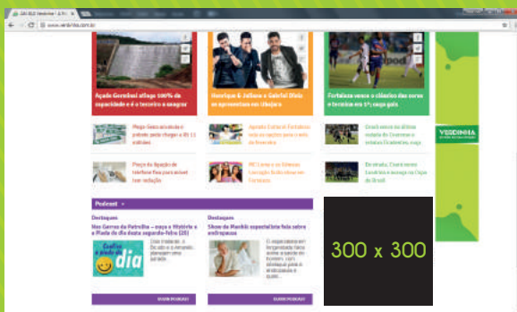
Quadrado 300x300 px