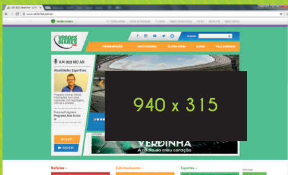
Intervenção 940x315 px