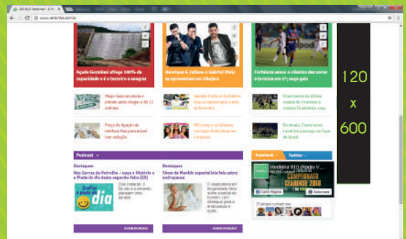
Sky Banner 120x600 px